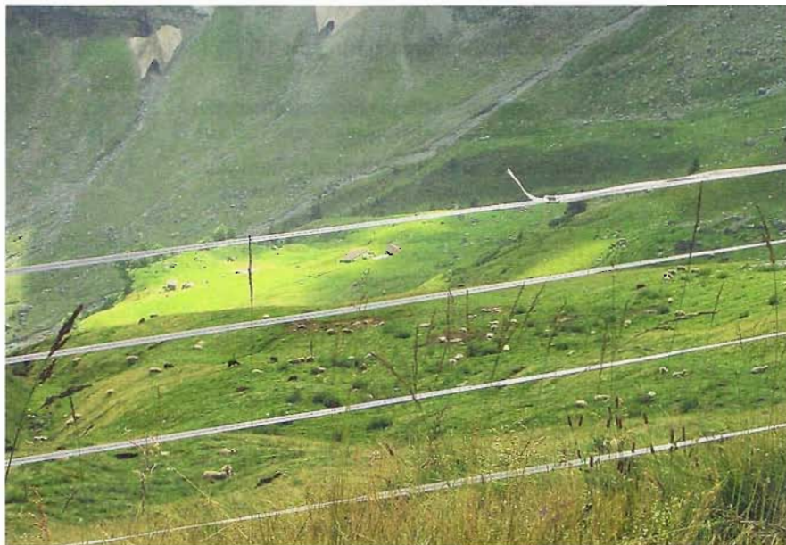
Der wirtschaftliche Erfolg der Sömmerung hängt einerseits von den Abgängen und andererseits von den Aufwendungen z.B. für die Erstellung von Zäunen ab.

La réussite économique de l'estivage n'est souvent un sujet de discussion qu'en marge dans la discussion sur l'estivage ovin. Pourtant, les dépenses et la charge pour l'exploitant et pour l'éleveur sont un fondement central de l'estivage ovin. Cependant, les exploitations d'estivage doivent également contribuer pour leur part au revenu agricole par une amélioration de l'efficacité. Dans beaucoup de vallées alpines, l'estivage constitue un lien important entre la population, le paysage, l'agriculture et le tourisme. La mise en valeur de ces exploitations joue donc un rôle essentiel.